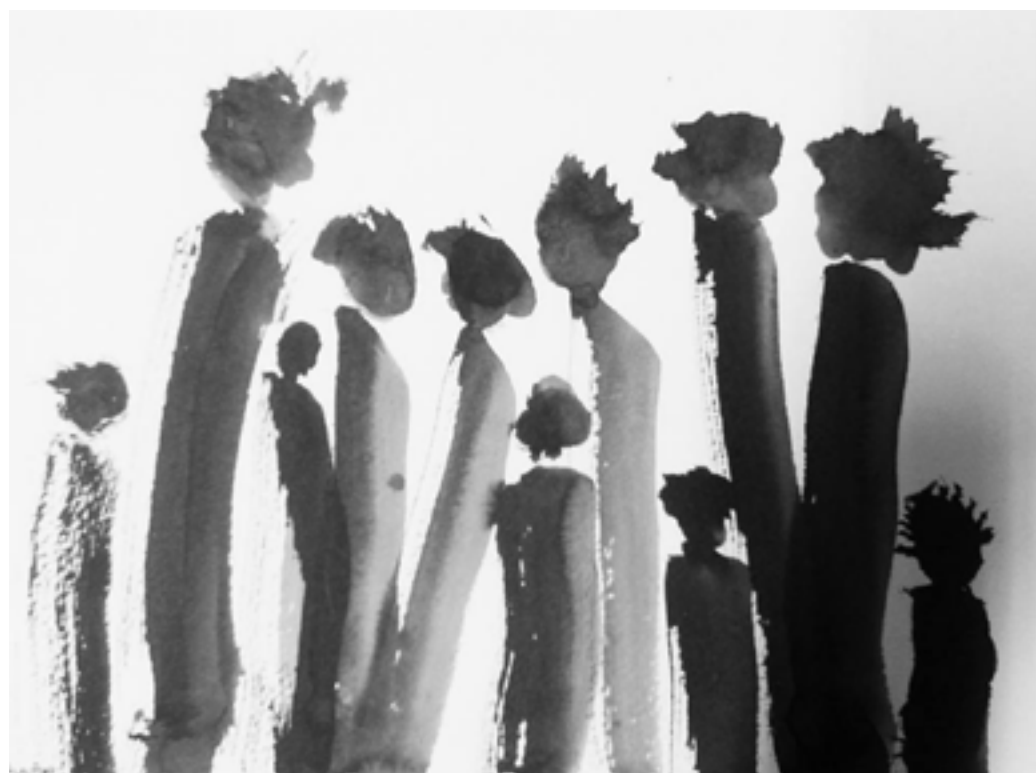
עסרב. אביבית חזק

הייתי הכל חוץ מלהיות זונה הייתי מרוקאית ספין הייתי טעונת טפוח הייתי טעונת קפוח הייתי ילדת השכונה הייתי אפליה מתקנת הייתי מתבשרת פי הייתי מתבוללת הייתי בוגדת בהורי שבאו מארץ אורינטאלית יפה עכשו אני חושפת מלים