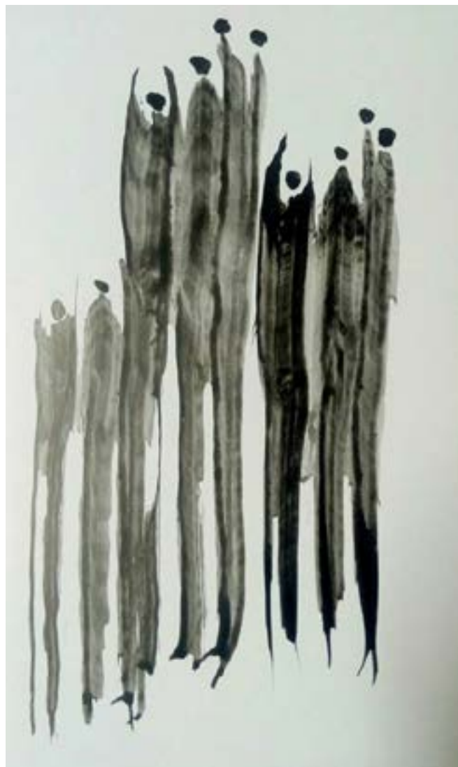
תפילת האדם. אביבית חזק

אינני עוד התקלה אינני עוד סוף במצולותיי מתגשמת הנני של העולם כלי גשר