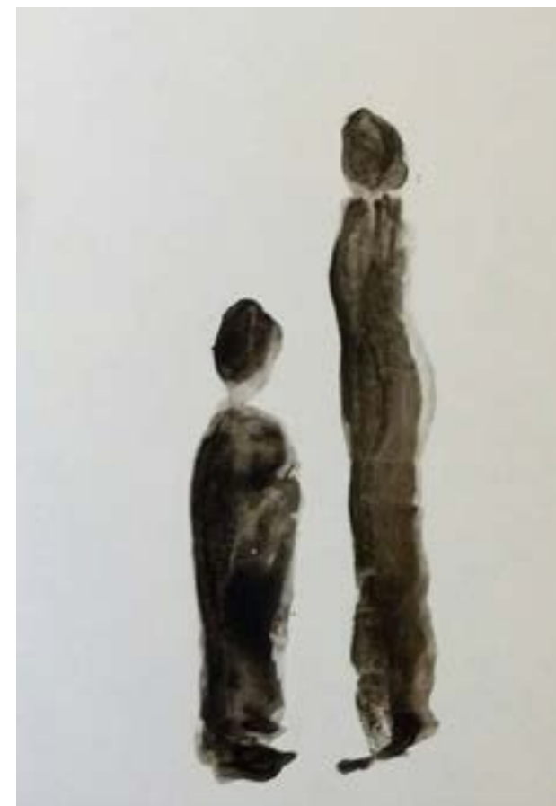
אם וילד. אביבית חזק

חיים ומוות הם נושא שמעסיק כל אדם ואדם. משוררים מעלים אותו באופנים, בדרכים ובהיבטים שונים.